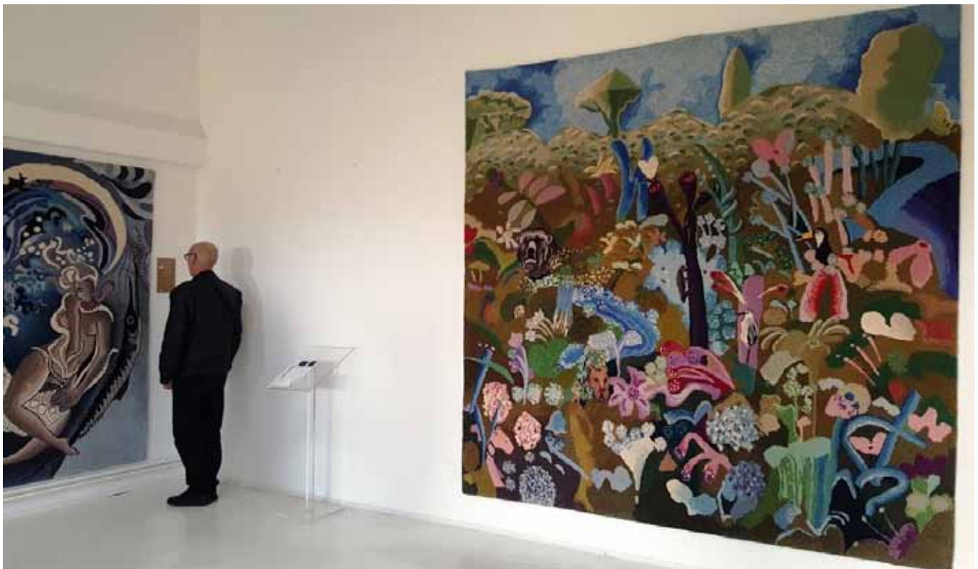
U muzeju Regeneracije Zabok