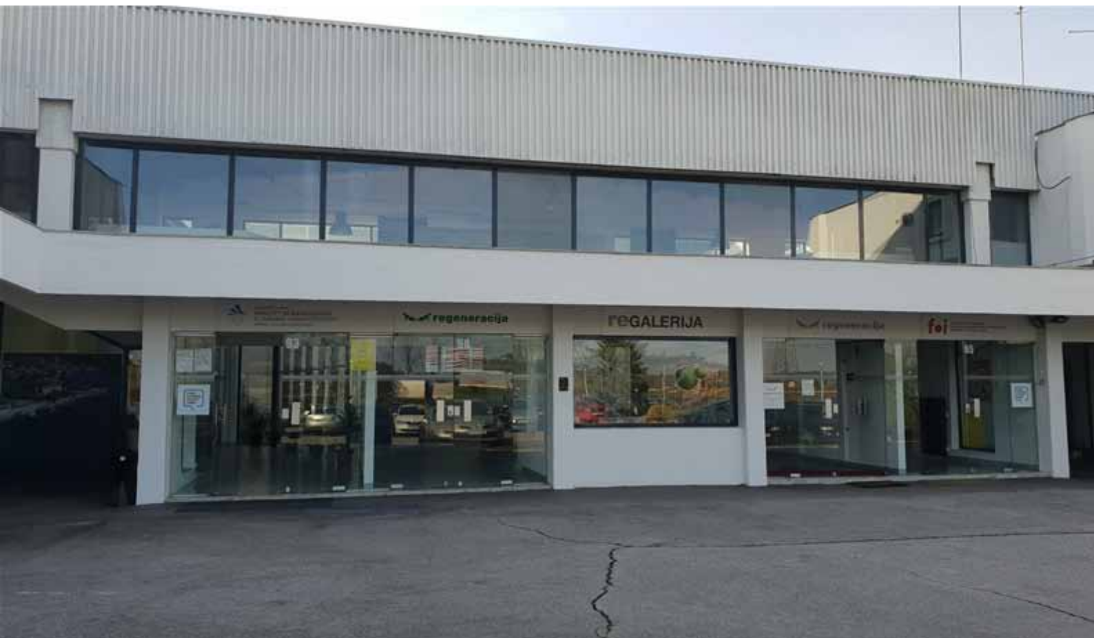
Pučko otvoreno učilište Zabok