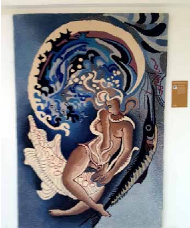
U muzeju Regeracije Zabok 2