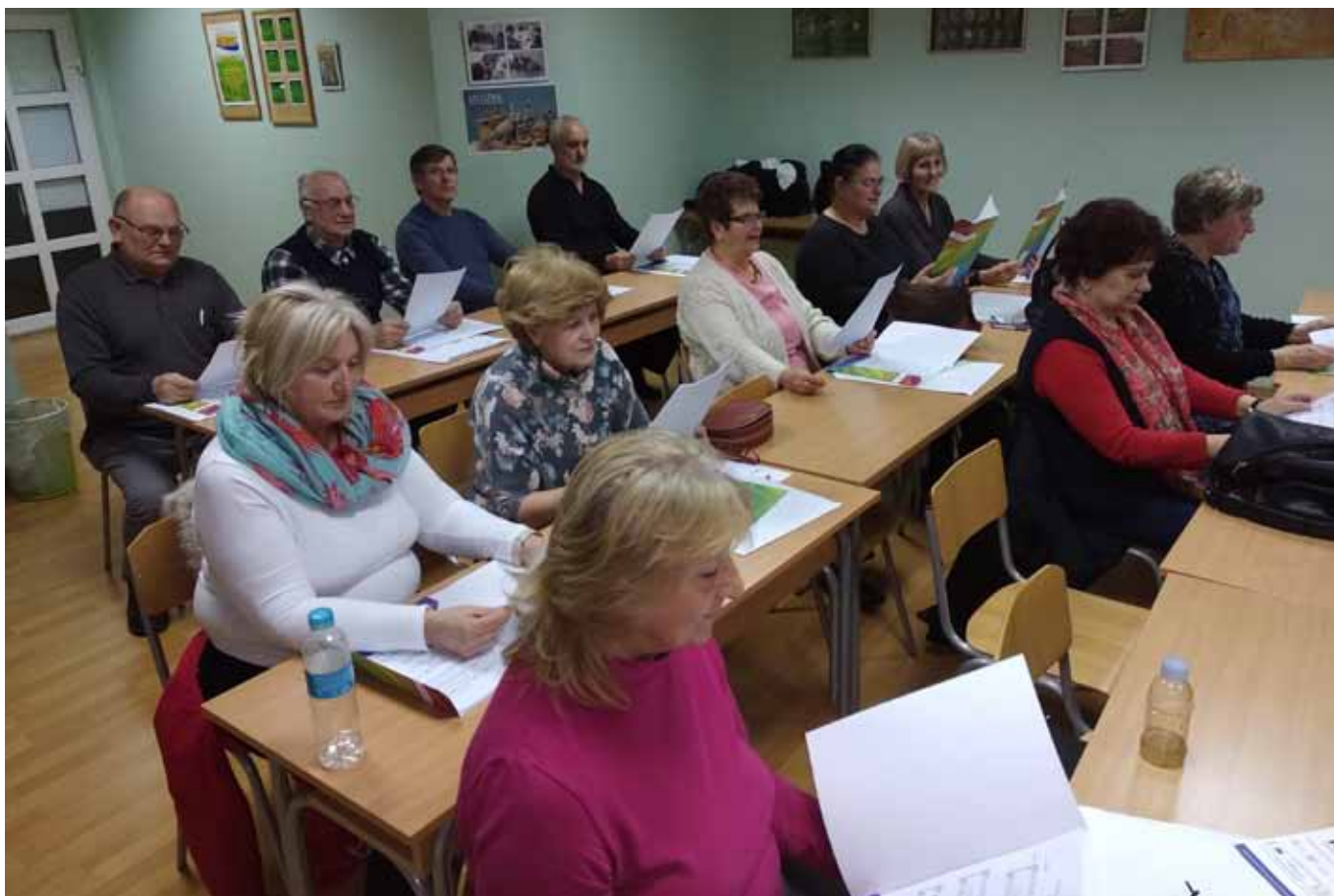
Probe u Osijeku