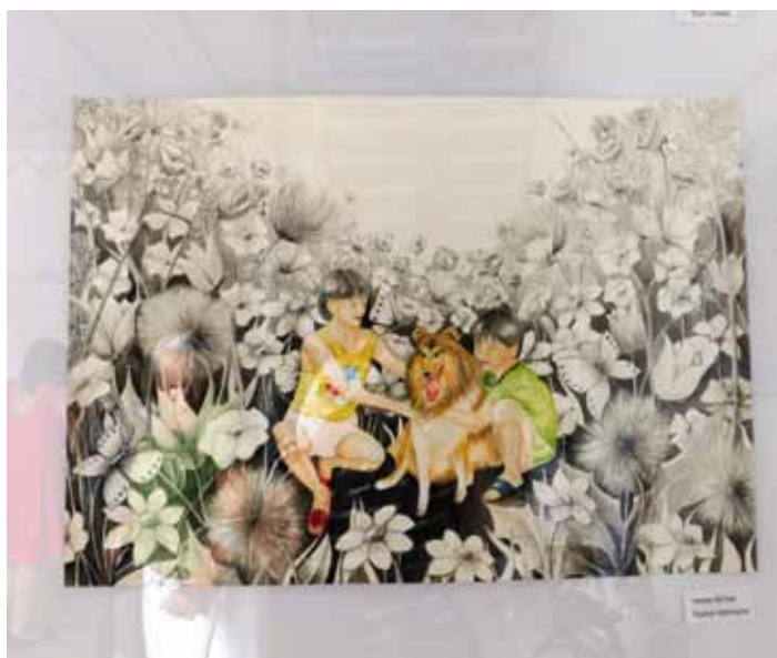
Restauracija uspomene