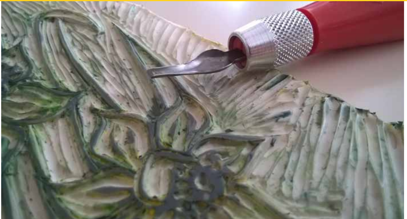
Linorez