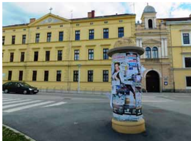
Neoklasicizam u Požegi

oba Miroslava Kraljevića, pisac prvoga požeškog romana Požeški dak i prvak hrvatske moderne. Tu je Oton Kučera osnovao prvu astronomsku promatračnicu, a nedavno je na zgradi požeške gimnazije otvorena prva zvjezdarnica u Slavoniji koja nosi njegovo ime. To su samo mali podsjetnici na jednu dugu i značajnu tradiciju obrazovanja koja se i danas slijedi. Pitali smo naše partnere što bi htjeli istaknuti u svome lijepome gradu, dobili smo odgovor: Pišite o obrazovanju, upoznajte, podsjetite na povijest toga kulturnoga i obrazovnoga žarišta čiji se plamičak, poput olimpijske vatre, brižljivo čuva.