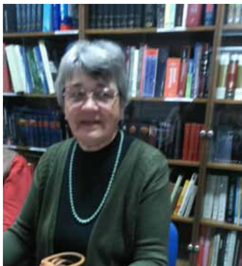
Anka Dorbić, arhiva POU Obrisa