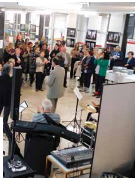
Izložba je otvorena!