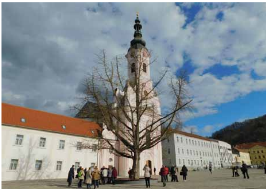
Trg svete Terezije s crkvom svete Terezije i bivšom zgradom gimnazije