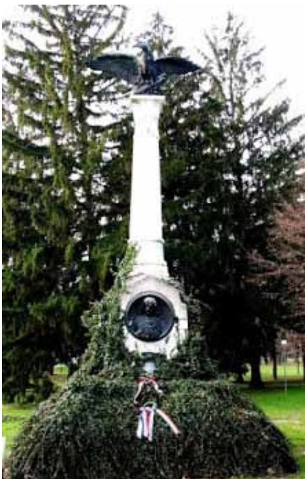
Spomenik Nikoli VII. Zrinskom