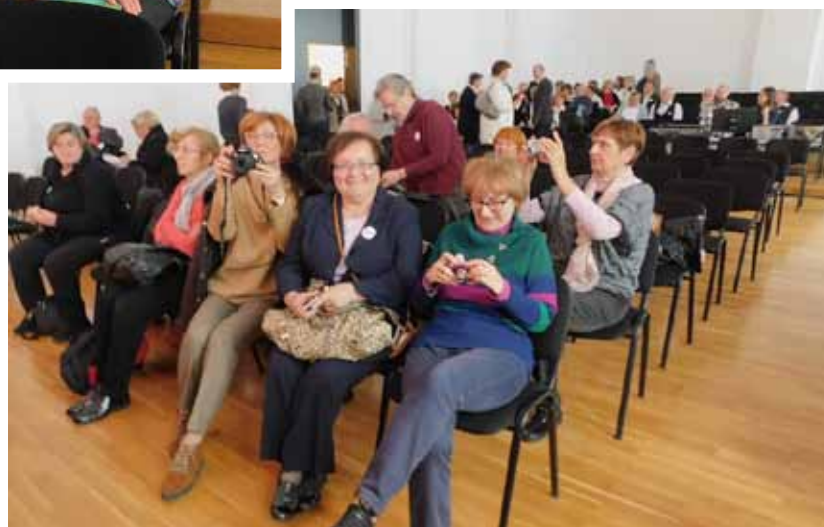
Fotoaparati spremni