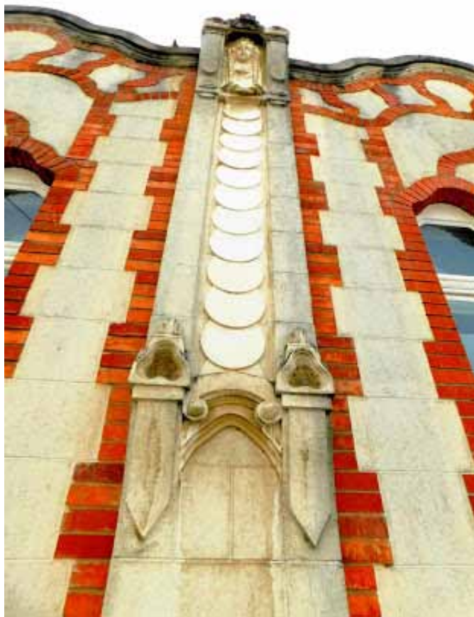
Detalj secesijske zgrade

Nakon prigodnoga programa, otvorenja izložbe i ručka u restoranu Pozoj (zma), domaćin nas je počastio obilaskom Muzeja Međimurja smještenoga u Staroj palači Zrinskih, udaljene tek stotinjak metara od glavnoga gradskog trga. Zgrade prostrane pješačke zone u središtu grada su prizemne ili jednokatnice, po mjeri čovjeka. Zaustavili smo se nakratko u Gradskoj kavani. Na zidu okrenutom prema terasi, naslikana je veduta Starog grada i vremenska lenta s portretima članova obitelji Zrinski koji su vladali Međimurjem, od sigetskoga junaka Nikole Šubića Zrinskog (1508.-1566.), do zadnjega, Adama (1662.-1691.). Kako dobra ideja, upoznati goste i prolaznike s onima koji su proslavili ovaj grad i Međimurje!