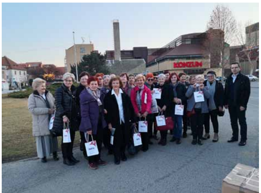
Čakovčani u Zaboku