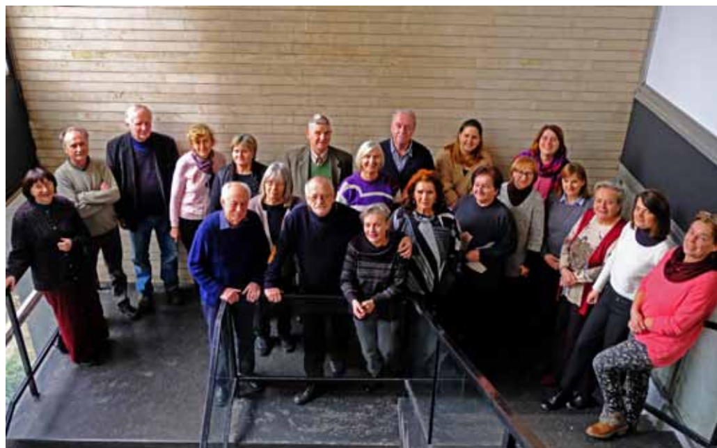
Fotografska radionica 1