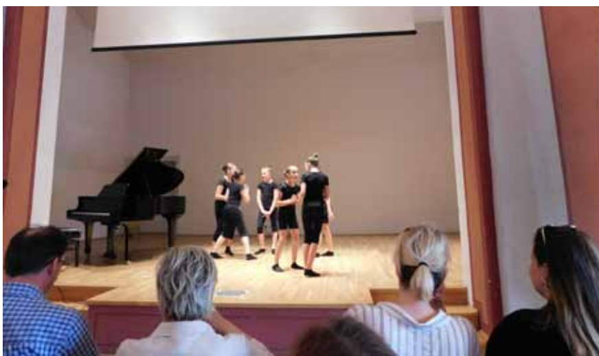
Mladi glumci iz škole u Maloj Subotici