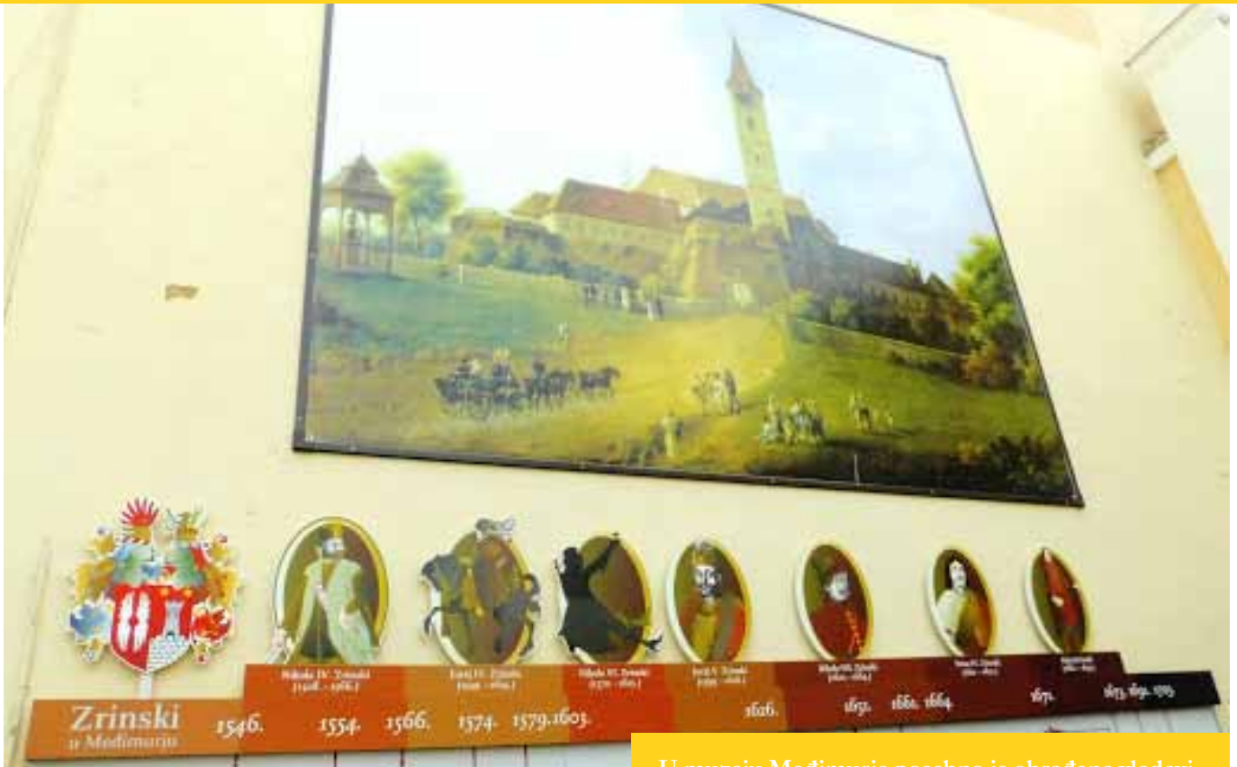
Zid Zrinskih u Gradskoj kavani