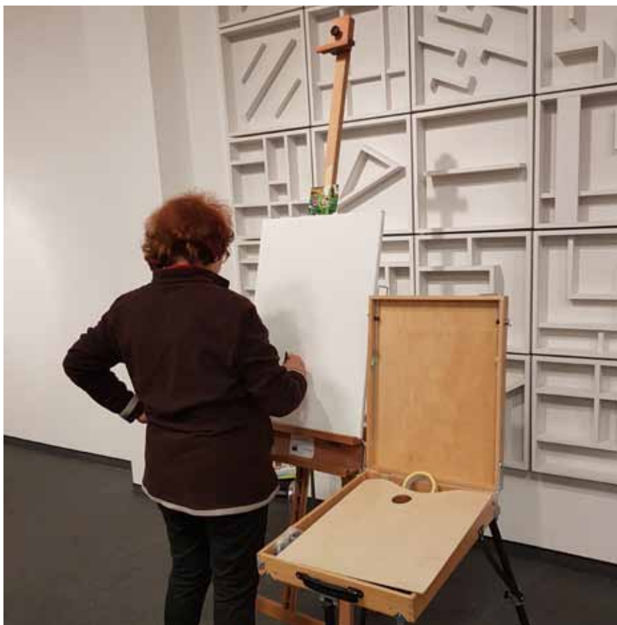
U zanosu stvaranja