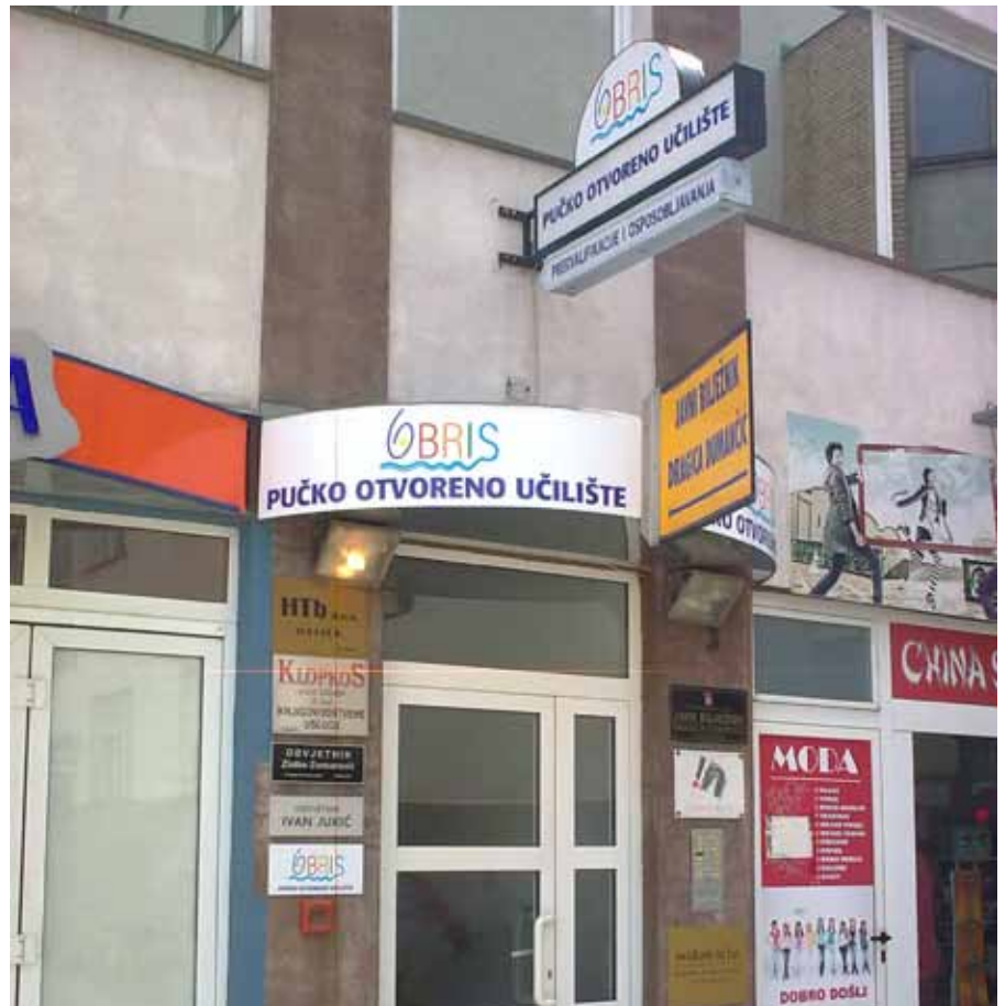
Podružnica Pučkoga otvorenog učilišta Obrisa u Osijeku, arhiva POU Obrisa

Danas djeluje na tri lokacije, u Požezi, Pakracu i Osijeku.