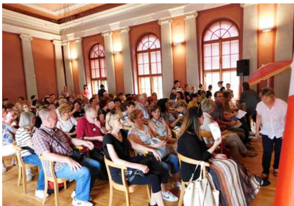
Partneri na okupu