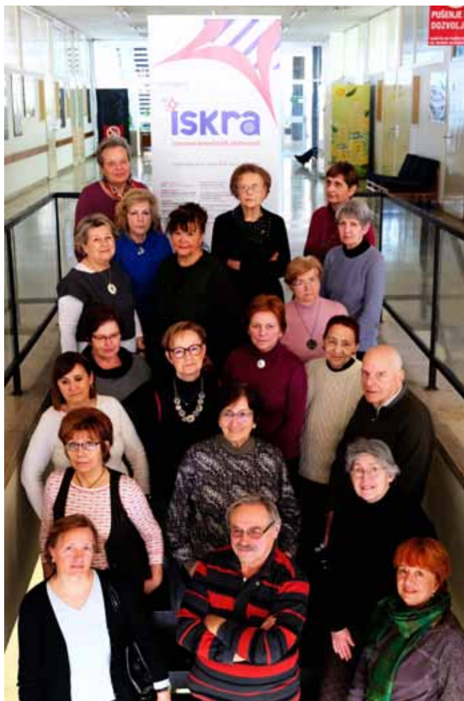
Fotografska radionica 2