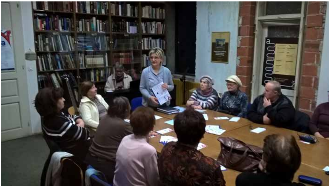
Proba u Pučkome otvorenom učilištu Obrisa