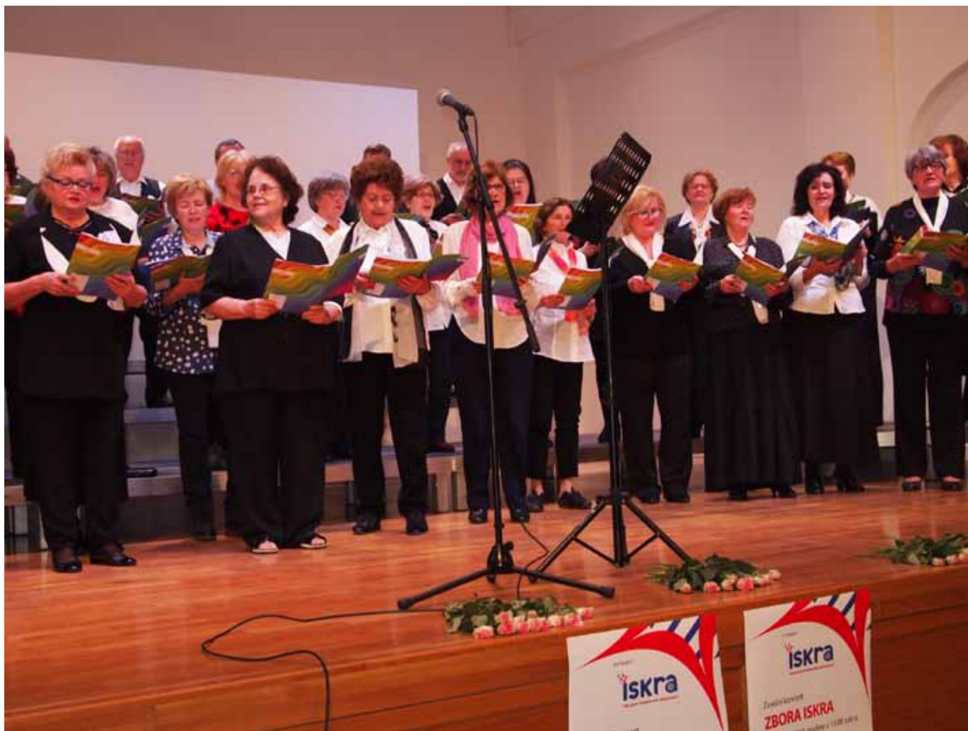
Zbor Iskra u punome zamahu