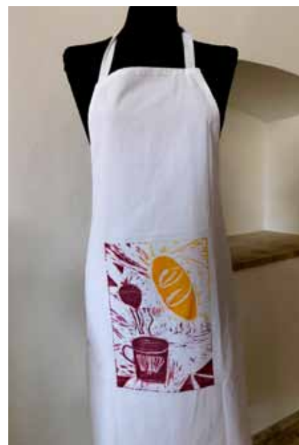
Pregača s otiskom