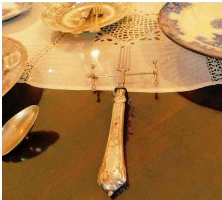
Nosač za vilicu, animila Višnja Vidmar