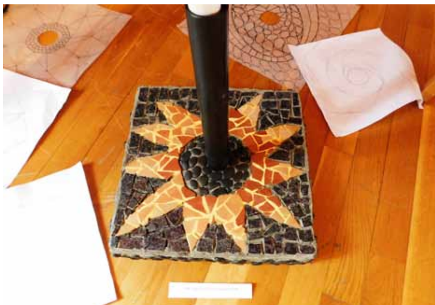
Kameno postolje za suncobran