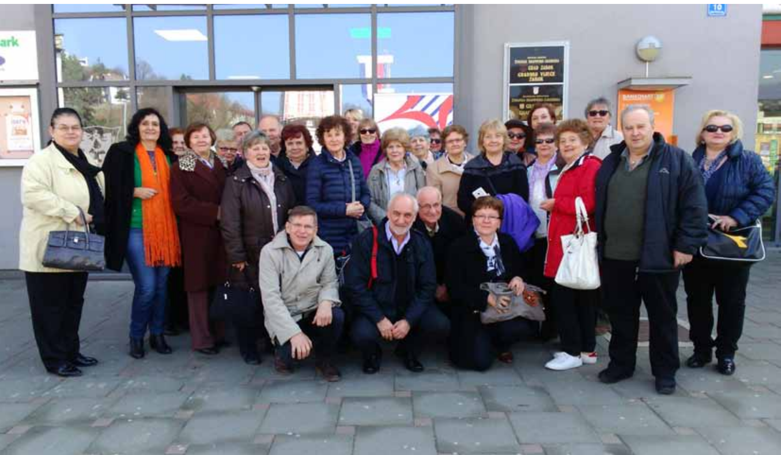
Skupna fotografija zborova iz Osijeka i Požege

U sklopu projekta Iskra, Učilište OBRIS organizira glazbene radionice za osobe starije od 54 godine u Požegi i u Podružnici u Osijeku.