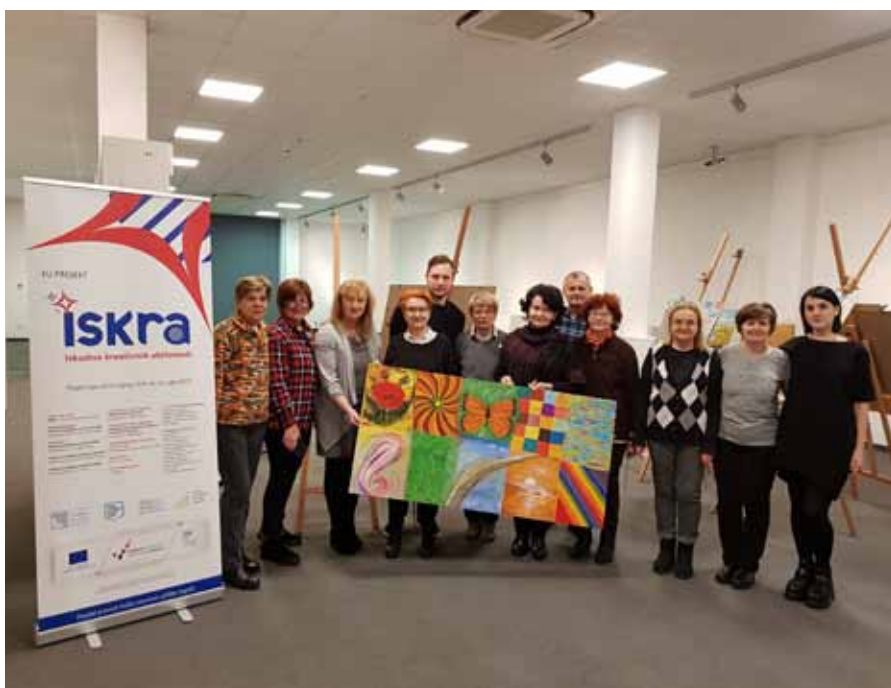
Zajednički pachwork