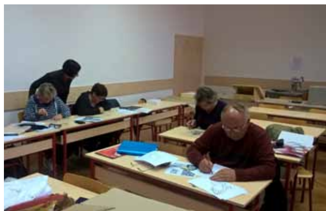
Radionica Linorez u umjetnosti u POU Čakovec

Učilište kao ustanova čiji je osnivač Grad Čakovec ima konstantnu podršku kako programskoj shemi obrazovanja odraslih i cjeloživotnoga učenja, tako i u logističkoj podršci. U tom smislu Učilište posjeduje kvalitetne nastavne i ostale prateće prostore za sve oblike realizacije ukupne djelatnosti. Učilište je opremljeno suvremenim nastavnim sredstvima i pomagalicama (tri moderna informatička laboratorija, specijalizirani kabinet za masere i pedikere, specijalizirane učionice za strane jezike s pametnim pločama te druge