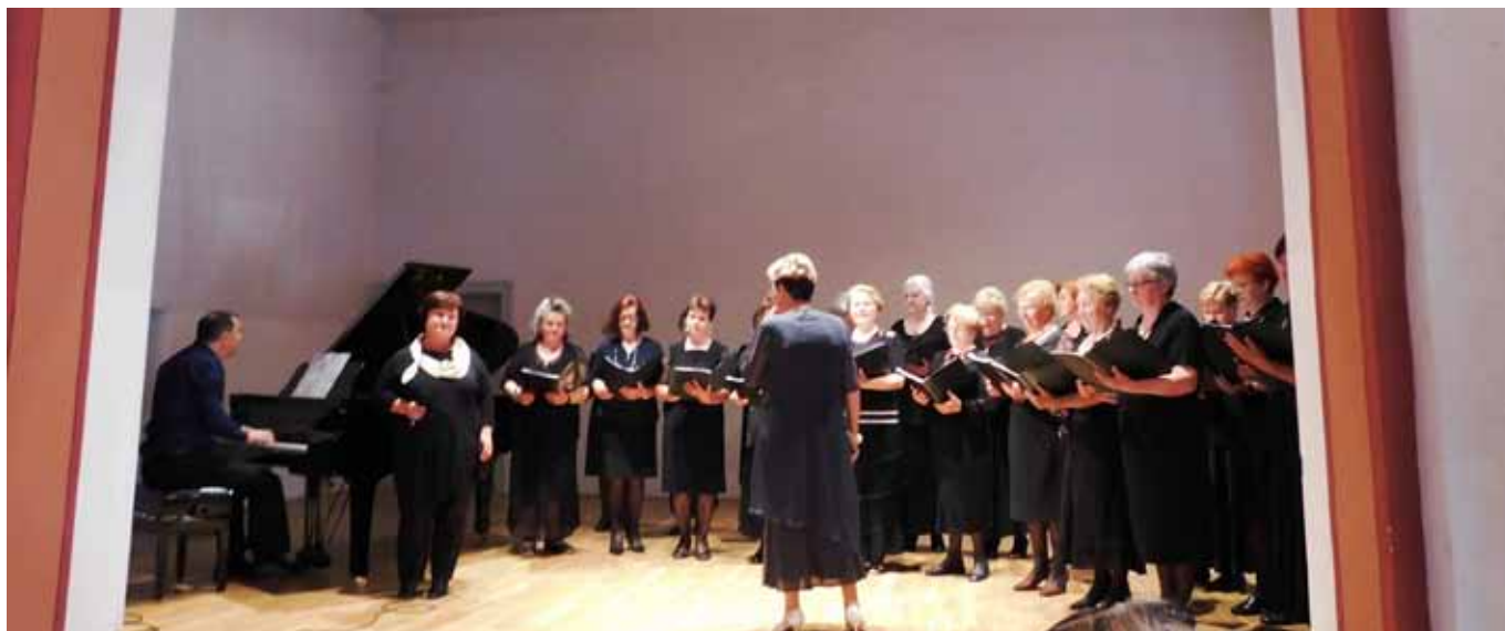
Zbor umirovljenika