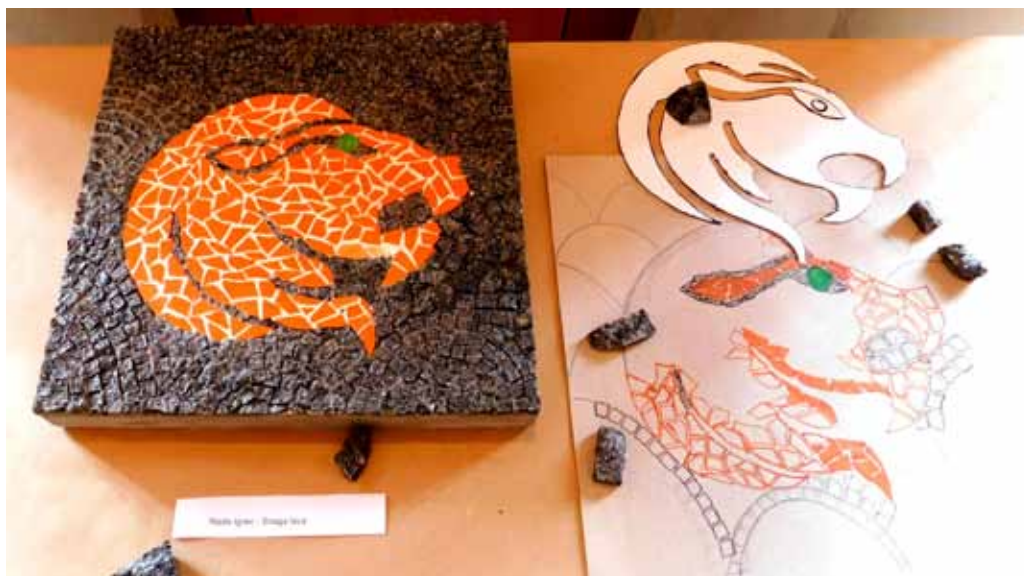
Lav, snimila Višnja Vidmar