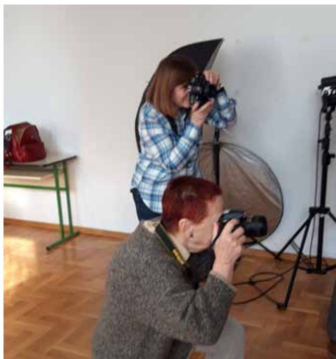
Bilježnje trenutka snimila Dubravka Škorić