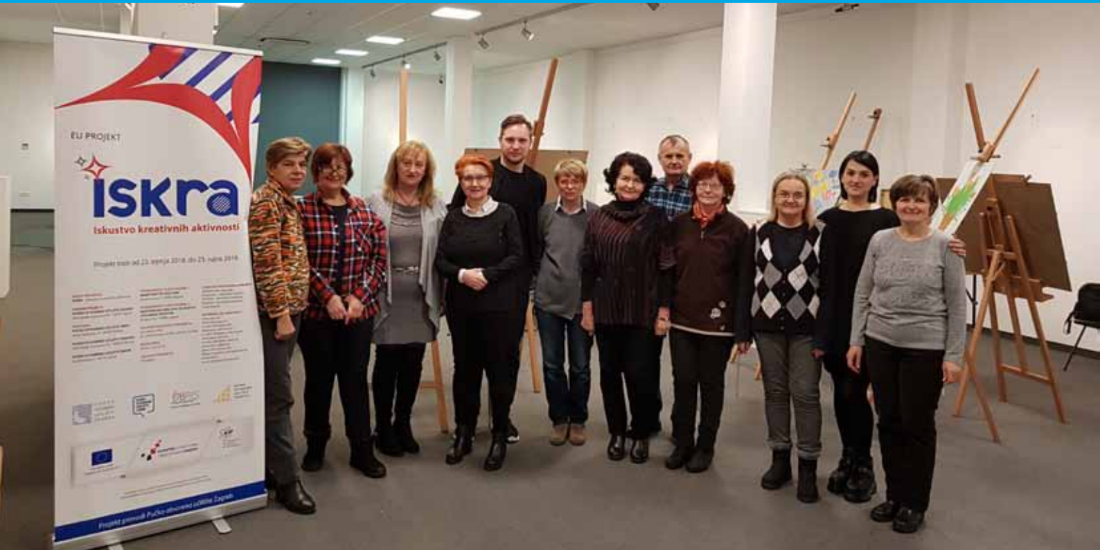
Okupili su se likovnjaci

Tijekom 2011. godine Pučko otvoreno učilište Zabok preuzima vođenje Velike gradske galerije grada Zaboka. U sklopu projekta Iskra, POU Zabok organizirao je likovnu radionicu za 10 polaznika u trajanju od ukupno 36 sati. Radionice su se održavale jednom tjedno u trajanju od tri sata. Prijave su započele na početnoj konferenciji projekta Iskra, 4. listopada 2018. godine u Zaboku, i mjesta su odmah bila popunjena.