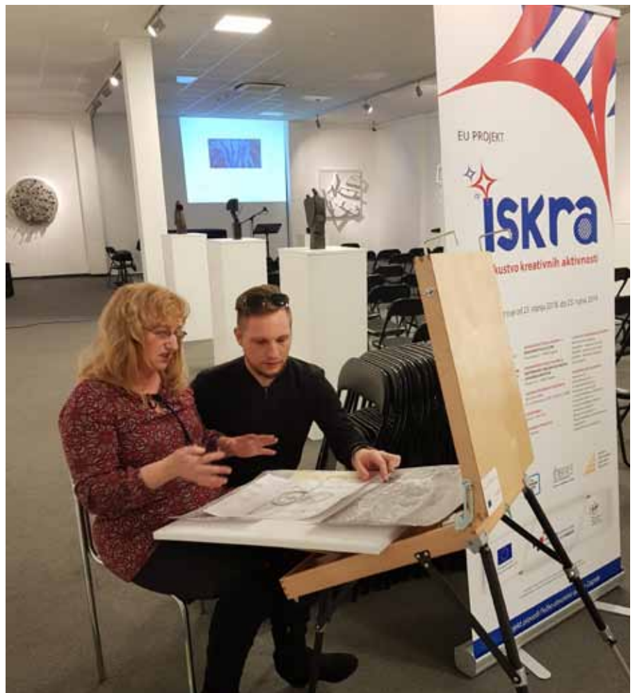
Na početku