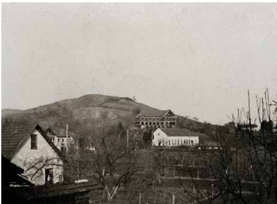
Stara zgrada učilišta (na vrhu)

Pučko otvoreno učilište Zabok djeluje na području grada i regije već 56 godina, a kao ustanova od 1961. godine. Programe visokog obrazovanja počinje provoditi 1996. godine u suradnji s Ekonomskim fakultetom u Zagrebu. Od 2000. godine provodi programe u suradnji s Fakultetom za menadžment u turizmu i ugostiteljstvu Opatija te od 2002. godine s Fakultetom organizacije i informatike iz Varaždina. Od 2014. godine u suradnji s Fakultetom odgojnih i obrazovnih znanosti iz Osijeka započinje suradnja na realizaciji psihološko pedagoške i didaktičko metodičke nastave.