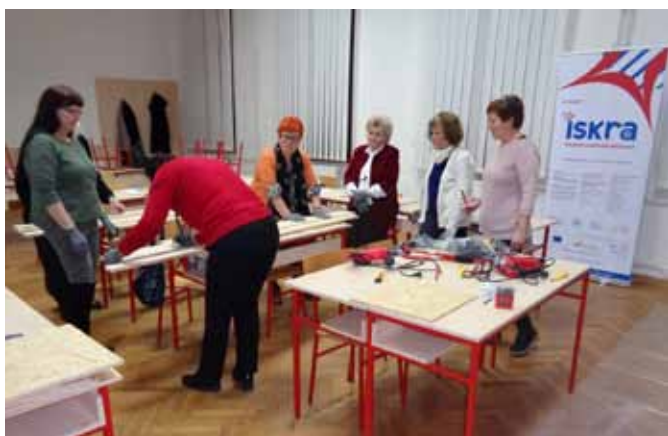
Radionica Kamene ploče u POU Čakovec

Pučko otvoreno učilište osnovano je 1950. godine kao Narodno sveučilište. Društvena zbivanja utjecala su na promjenu imena pa se mijenja u Radničko sveučilište, a 1989. u Otvoreno sveučilište, poduzeće za kulturu. 1997. postaje Pučko otvoreno učilište. Ono je danas andragoška ustanova koja djeluje kao centar cjeloživotnoga učenja. Učilište je javna ustanova čiji je osnivač jedinica lokalne samouprave odnosno Grad Čakovec. Svojim programima oduvijek je pratilo razvojni tijek društvenih procesa s ciljem da pomogne rješavanju potreba naše okoline, a s tim je pridonijelo i svojemu vlastitom razvoju. U vremenu suočavanja s novim mogućnostima i izazovima na temelju tržišne orijentacije, samo kreativni i intenzivni rad mogao je pridonijeti dobrom poslovanju ove ustanove. Promjene u privredi i ukupnom društveno-političkom sistemu iziskuje značajne promjene u strukturi znanja i obrazovanja radnih ljudi i mladeži te su i pojedini programi doživljavali modifikaciju ili su potpuno nestali, a novi se morali stvarati. Ta činjenica govori da ova ustanova ne smije biti troma, nego