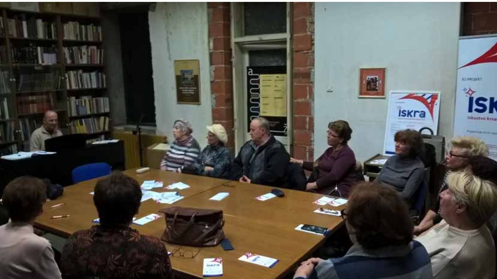
Proba zbora u Požegi, arhiva POU Obris