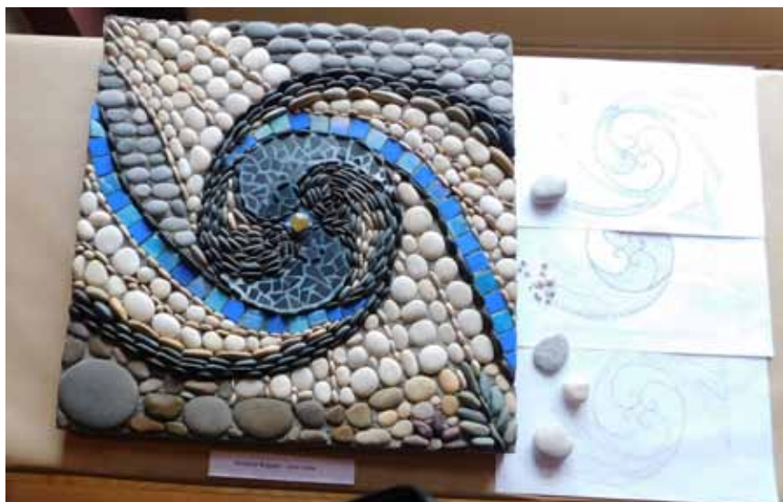
Izvor vode