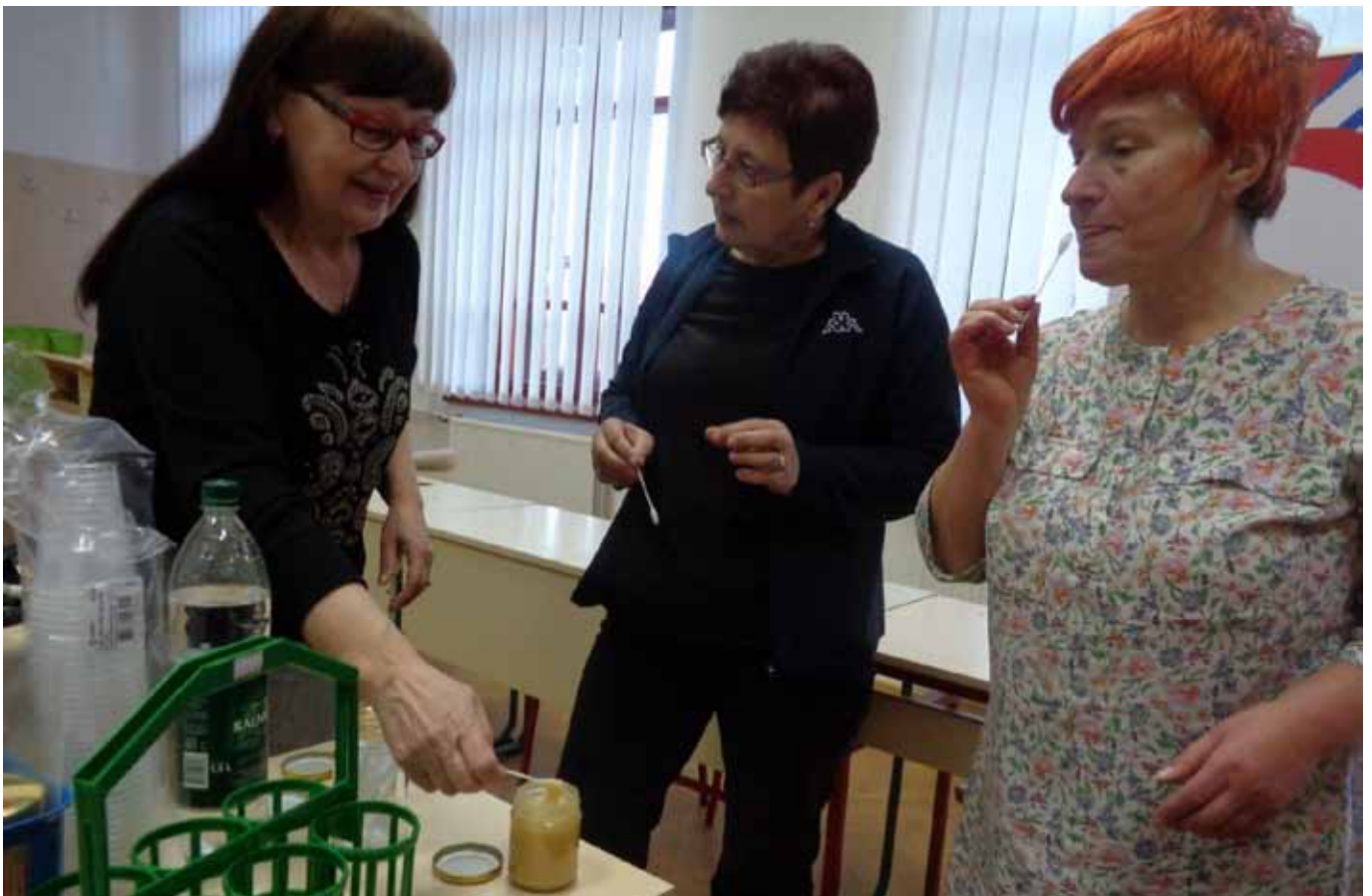
Mali predah, snimila Kristina Pongrac