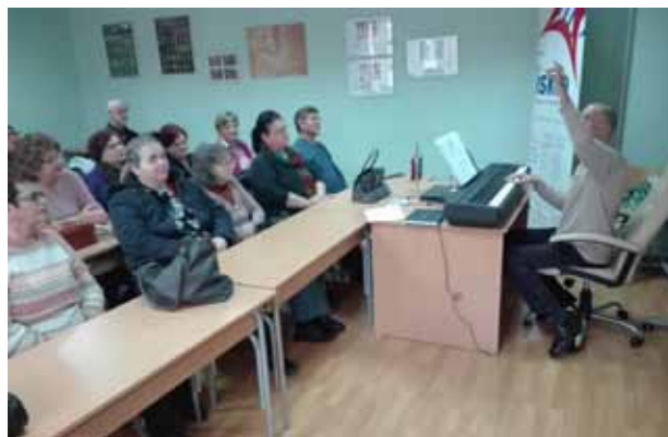
Probe u Osijeku, arhiva POU Obrisa, podružnica Osijek