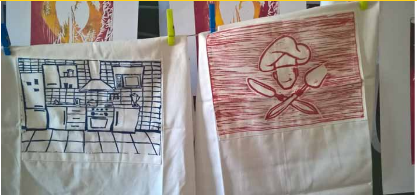
Linorez