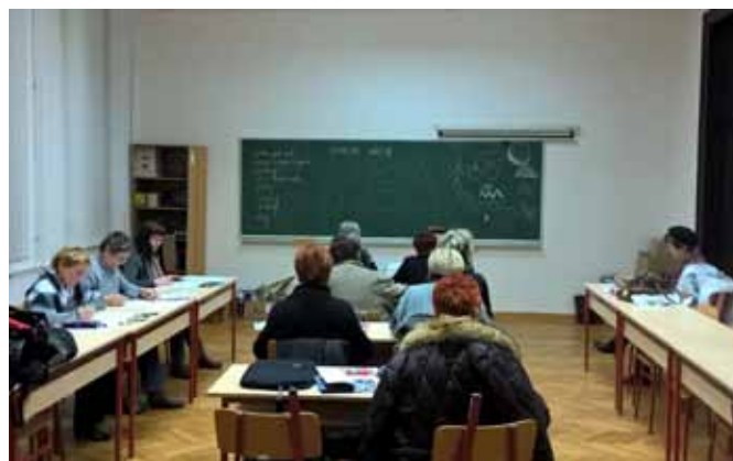
Radionica Restauracija uspomene u POU Čakovec

dinamična u neprestanome istraživanju potreba naše okoline i stvaranju novih programa.