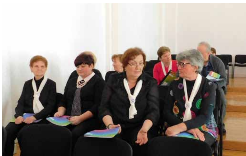
Zboristice na čekanju